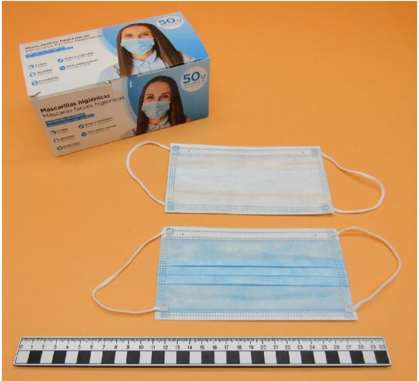
Mascarilla higiénicas no reutilizable Ref. 120722 (Lote: 264870)